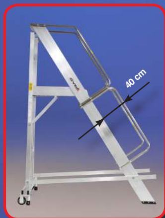
Schienale perpendicolare al terreno