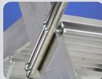
Aggancio inferiore del corrimano