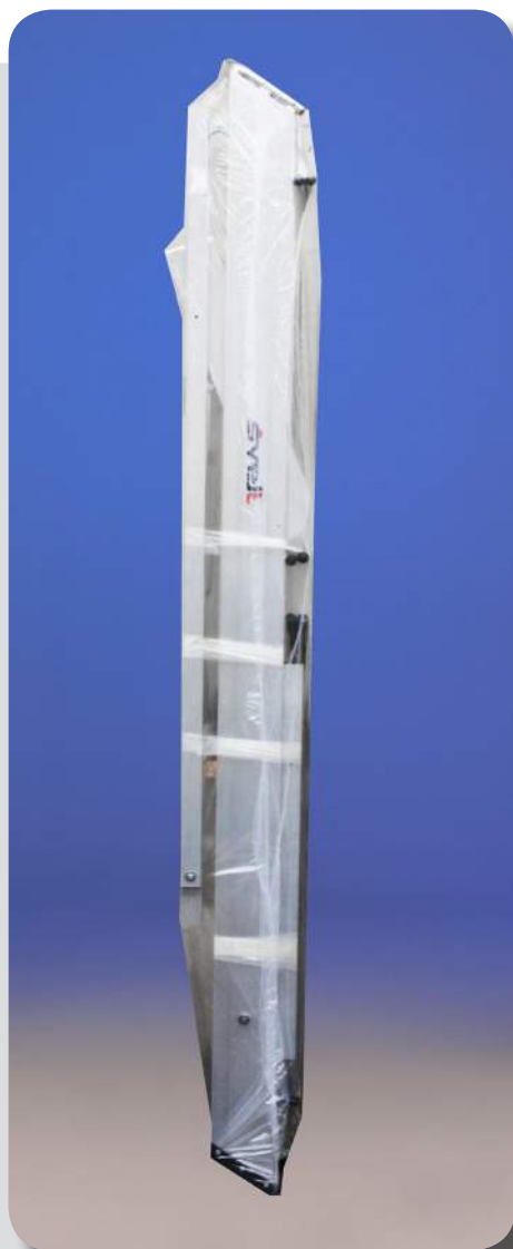
Imballata in termoretraibile è supercompatta (vedi tabella)

Il corrimano è stato pensato per essere smontabile per agevolare le fasi di trasporto e di stoccaggio della scala. Questo consente alla scala di non essere danneggiata durante il tragitto. La scala castellana maxi viene imballata perfettamente per evitare danneggiamenti durante il trasporto. La scala è perfettamente stabile e offre un senso di sicurezza unico nel suo genere.