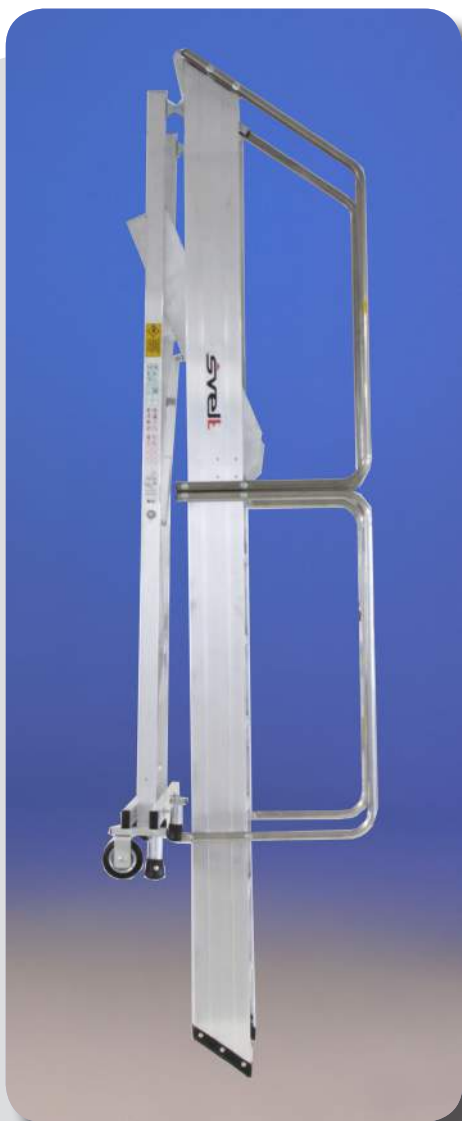
Spessore chiuso (corrimano montato) cm 75