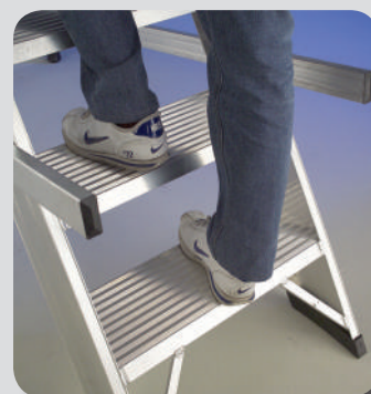
Comodo gradino cm 20